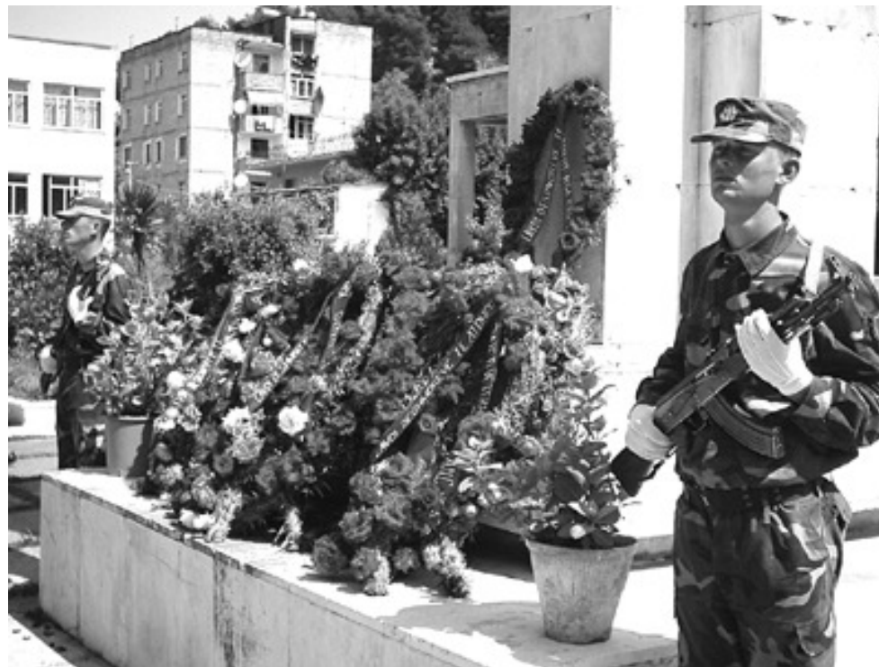
Berat, 5 Maj 2006

Pozita dhe opozita kanë vënë kurora me lule në varrezat e dëshmorëve në Berat. Titullarë nga prefektura, bashkitë dhe të institucioneve të tjera të Beratit kanë bërë homazhe dhe kanë marrë pjesë në ceremoninë e rivarrimit të katër trupave të shpallur dëshmorë, por që deri dje nuk preheshin në varrezat e dëshmorëve.