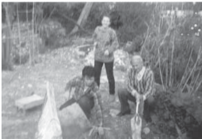
Sofra e Shëndëlliut

Një evropian, zëvendës-president i UNESKOS, midis shumë të tjerave, ka theksuar: "Ky vend është i privilegjuar, sepse e ka përkëdhelur Perëndia". Kjo thënie shpirtërore është dëshmi e së vërtetës, trashëgimisë, si pjesë e kulturës në kujtesën e kohës.